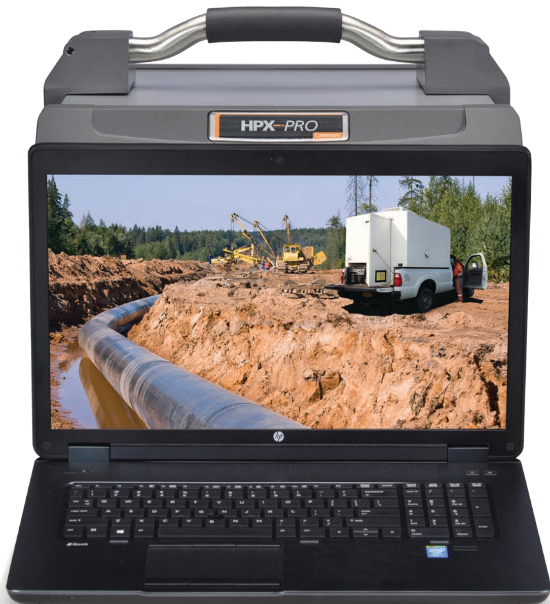
Dimensions du produit à l'échelle.

répondre aux cadences élevées comme pour le contrôle radiographique des soudures de pipelines. Les nouveaux outils logiciels permettent également de procéder à une analyse rapide des images et de générer des rapports clients personnalisés en quelques secondes. Avec un lecteur numériseur entièrement nouveau et un logiciel performant permettant d'obtenir des images et de les partager rapidement dans les conditions de chantier les plus difficiles, le HPX-PRO offre une solution complète, spécialement conçue pour améliorer votre productivité.