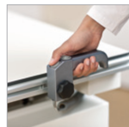
Tavolo con piano inclinabile: maniglia singola