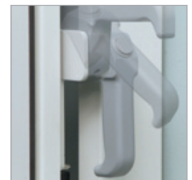
Maniglia di comando EZ-Glide