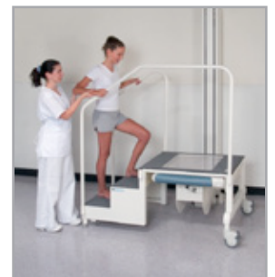
Pedane per il supporto del peso