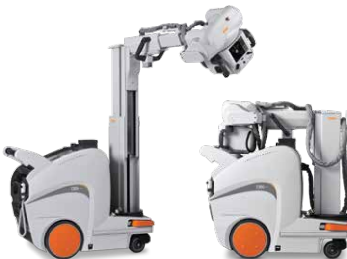
La colonna collassabile del DRX-Revolution rende facile la navigazione.

Per una produttività accelerata e una cura del paziente di qualità elevata, unitevi alla rivoluzione. DRX-Revolution.