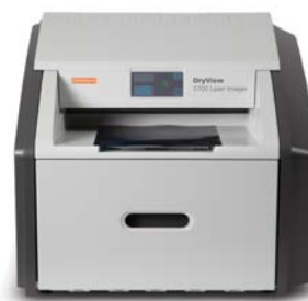
Drukarka laserowa DRYVIEW 5700