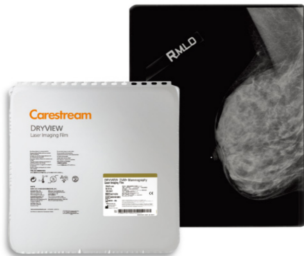
DRYVIEW胶片提供乳腺放射成像应用首选的高胶片密度。

在患者数量集中或偏多的情况下，高速运转的DRYVIEW 6950干式激光成像仪能保证您即使在最繁忙的时段也能维持平稳、高效的工作状态。该系统每小时可以打印160至250张胶片，无论胶片的尺寸是多少，都可以呈现及其锐利的650 ppi分辨率。凭借这项可以让您高枕无忧的性能，当未来出现设备进步时您将可以从容应对。